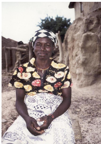
Deelnemster van de vrouwengroep Kate Inye