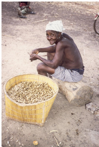
Doppen van de pinda-oogst